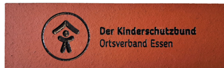
Individueller Spenderstein für das neue Kinderschutzhaus

Um diese Ziele zu erreichen, arbeiten im Kinderschutzbund Essen über 350 Fachkräfte gemeinsam mit gut 500 ehrenamtlich Engagierten in den stadtweit 24 Einrichtungen und Projekten. Sie bilden zusammen mit derzeit rund 600 Mitgliedern des gemeinnützigen Vereins, zahlreichen Förderern und vielen Kooperationspartnern ein lebendiges Netzwerk für einen erfolgreichen Schutz der Kinder in unserer Stadt Essen.