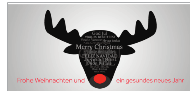
„Black Elch“ Bestellnummer 200 10 20