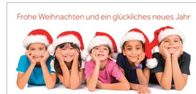
„Fünf freche Nikoläuse“ Bestellnummer 200 00 50