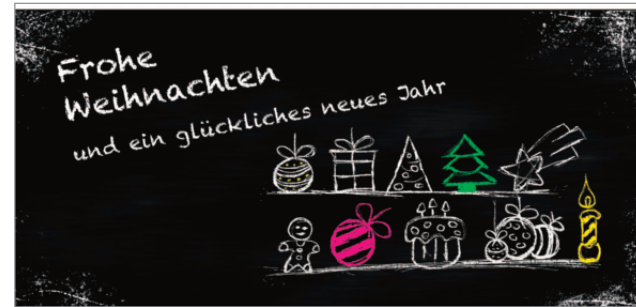
„Weihnachtsgruß Weiß auf Schwarz“ Bestellnummer 200 20 40