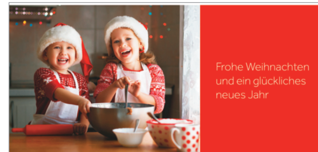
„Weihnachtsbäckerei“ Bestellnummer 200 00 70