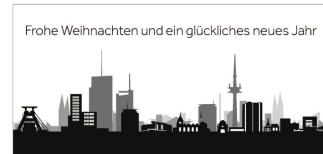
„Weihnachtsgruß Glückauf“ Bestellnummer 200 00 20