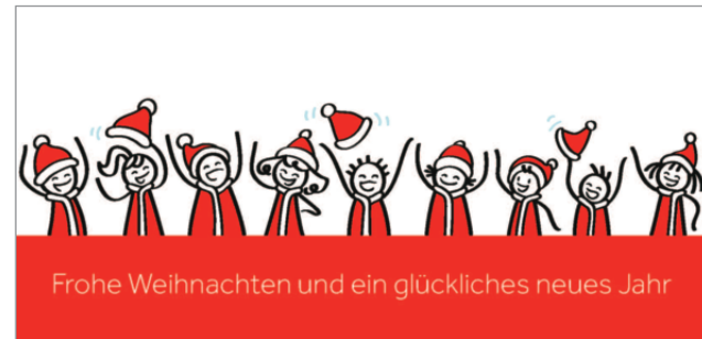
„Fröhliche Nikoläuse“ Bestellnummer 200 00 90