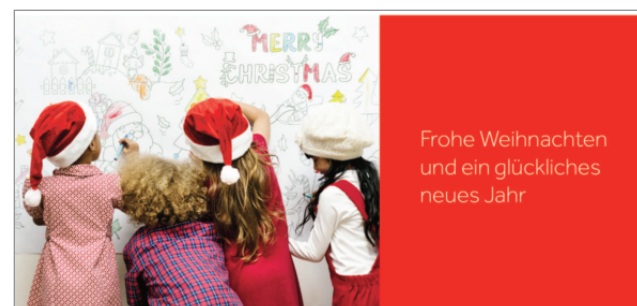
„Weihnachtsatelier“ Bestellnummer 200 00 80