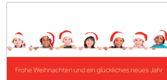
„Kleine Nikoläuse“ Bestellnummer 200 00 40

*Preis enthält einen freiwilligen Spendenanteil von 3 Euro.