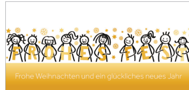
„Frohes Fest“ Bestellnummer 200 10 100