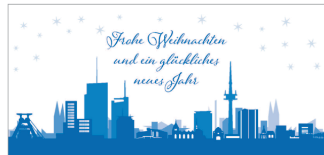
„Weihnachtsgruß Essen“ Bestellnummer 200 00 10