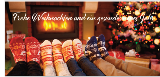
„Winterzeit - Kuschelzeit“ Bestellnummer 200 00 60