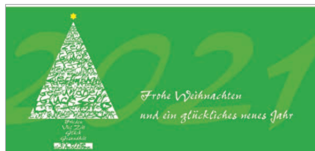
„Tannengruß Frieden“ Bestellnummer 200 10 50