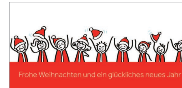
„Fröhliche Nikoläuse“ Bestellnummer 200 00 90