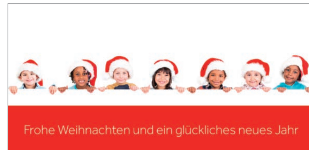
„Kleine Nikoläuse“ Bestellnummer 200 00 40

Eine bunte Vielfalt an Motiven lädt Sie dazu ein, fröhliche und besinnliche Advents- und Weihnachtsgrüße und Neujahrswünsche zu versenden.