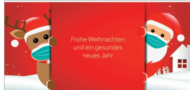
„Gesunde Neujahrsgriße“ Bestellnummer 200 10 20