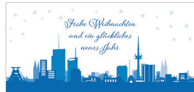
„Weihnachtsgruß Essen“ Bestellnummer 200 00 10