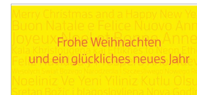
„Sommergelber Wintergruß“ Bestellnummer 200 00 30