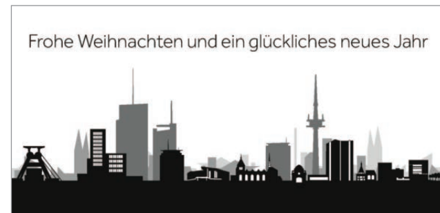
„Weihnachtsgruß Glückauf“ Bestellnummer 200 00 20