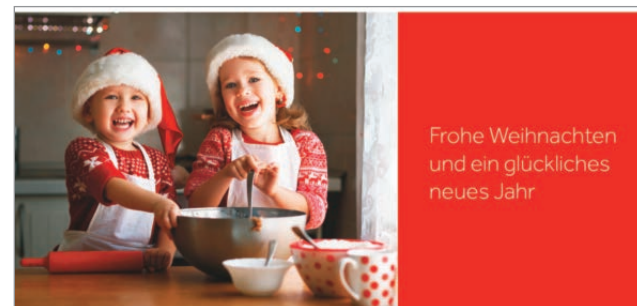
„Weihnachtsbäckerei“ Bestellnummer 200 00 70