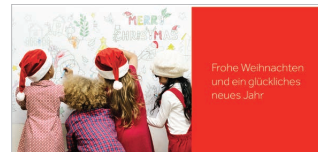
„Weihnachtsatelier“ Bestellnummer 200 00 80