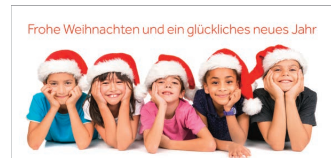
„Fünf freche Nikoläuse“ Bestellnummer 200 00 50