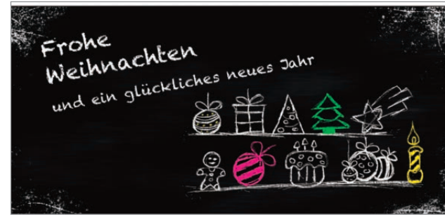
„Weihnachtsgruß Weiß auf Schwarz“ Bestellnummer 200 20 40