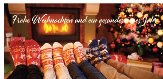
„Winterzeit - Kuschelzeit“ Bestellnummer 200 00 60