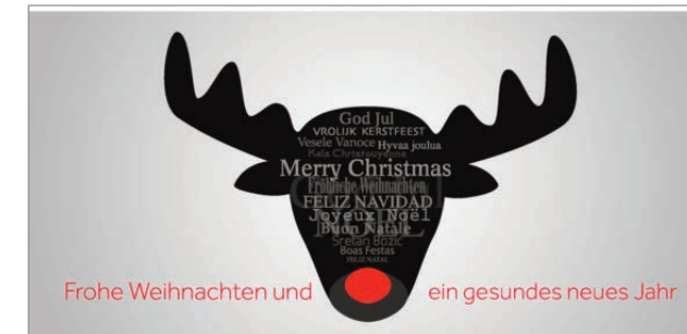
„Black Elch“ Bestellnummer 200 10 20