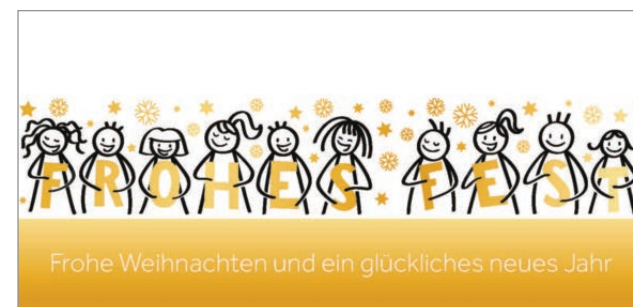
„Frohes Fest“ Bestellnummer 200 10 100